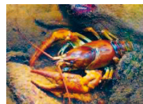
Obersigglinger Bach Steinkrebse