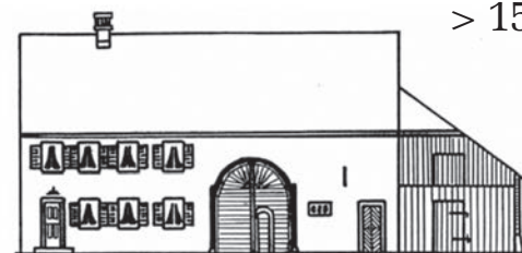
Ortschaftsmuseum Untersiggenthal seit 1980