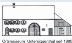
Ortsmuseum Untersiggenthal seit 1980

Der Verein fördert den Schutz und die Biotoppflege für freilebende Vögel. Er organisiert geeignete Naturschutz- und Vogelkundeprojekte und unterstützt die Zusammenarbeit mit anderen gleichgesinnten Organisationen. An der MUSE können Sie am Info-Stand des Vereins Ausstellungstafeln mit 6 Lebensräumen für Vögel (Siedlung, Landwirtschaft, Gewässer, Hecken, Wälder und Obstgärten) anschauen.