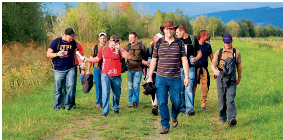
Die Feuerwehr-Aktiven und -Passiven auf Vereinsreise.

startete mit einem ausgiebigen Frühstücksbuffet. Danach ging es zu Fuss zurück in die Schweiz und mit der Bahn nach Landquart. Nach dem Mittagessen ging es zurück nach Hause. Es war eine unvergessliche Feuerwehrreise, die wir in guter Erinnerung behalten werden.