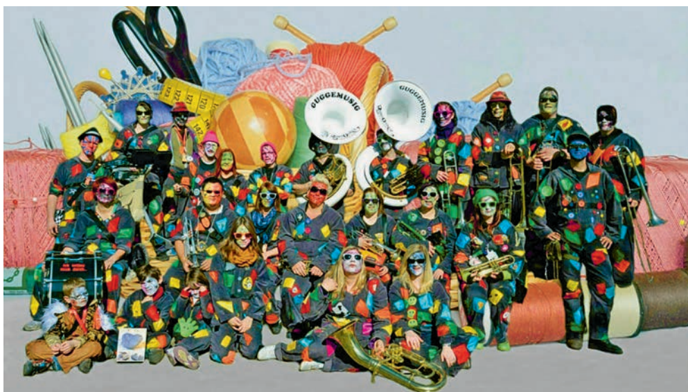
Die Räbefoniker in den 2014-Kostümen.

Und solange es die Fasnacht gibt, so lange wird es Musikanten geben, welche die Tradition der Guggenmusik jedes Jahr aufs Neue aufleben lassen.