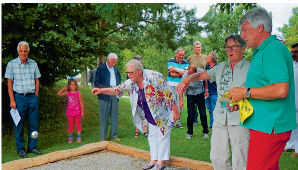
Einweihung der Pétanque-Bahn anlässlich des Sommerfestes 2014.

Nach dem Vortrag wird ein Apéro offeriert. Der Vortrag ist kostenlos.