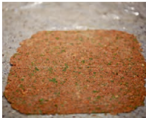
Vorbereitung der Lächerli-Kruste.

Gemüse, Schalotte und Knoblauch klein würfeln. In einer Pfanne das Öl erhitzen.