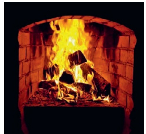
Tatsache 7: Kein Haushaltsabfall in den Cheminée!

Wenn Sie Fragen zu Entsorgung und Recycling haben, wenden Sie sich an die Abteilung Bau und Planung, Tel.: 056 298 03 00. Sie berät Sie gern.