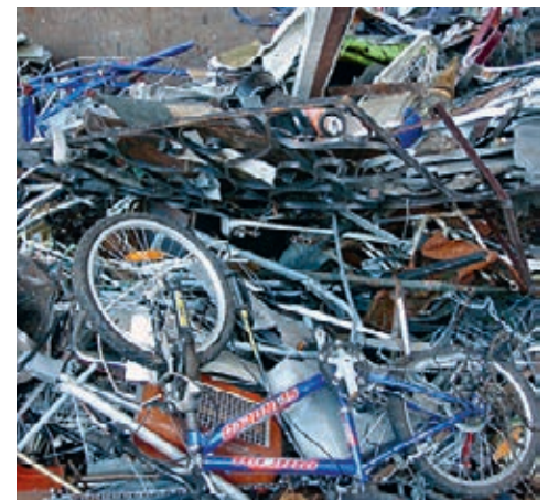
Tatsache 3: Altmetall nicht in die Abfallsäcke!