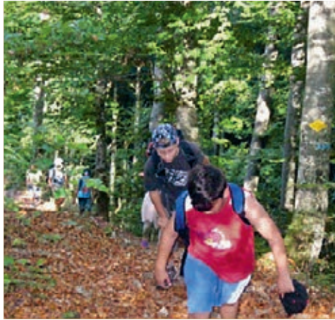
Zusammen erklimmen wir den steilen Berg. Starke Kinder schaffen das.