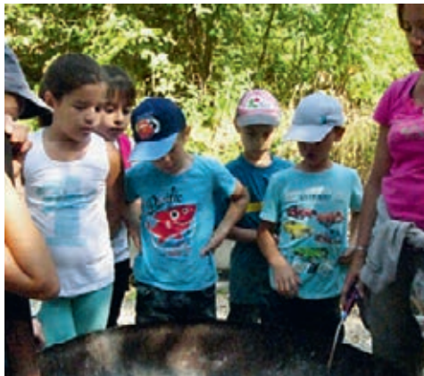
Starke Kinder können zusammen Feuer entfachen.