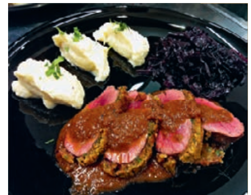
Rehrücken mit Püree und Rotkraut.

Zum Servieren das Rehrückenfilet leicht schräg in breite Scheiben schneiden. Dazu Rotkraut und Händöpfelstock servieren.