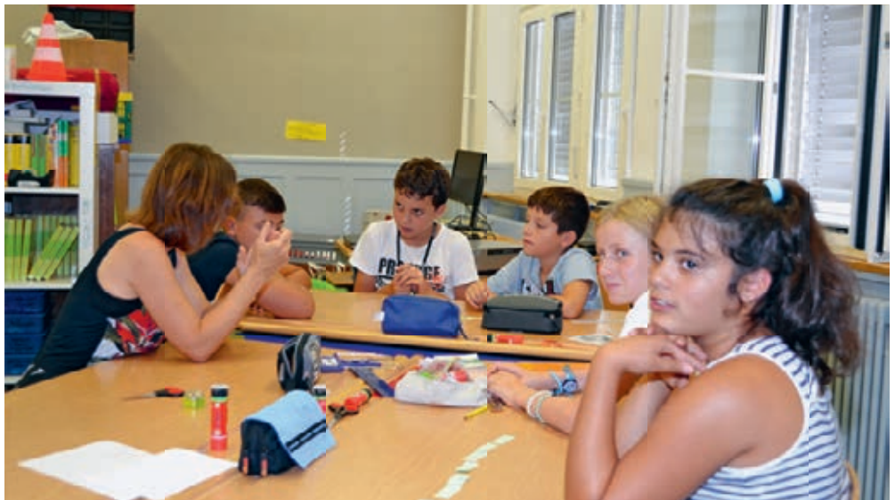
Intensives Lernen in kleinen Gruppen.