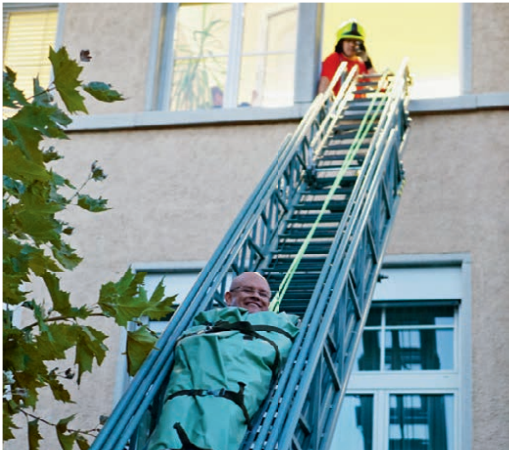
Als Übung ein grosser Spass, im Ernstfall weniger lustig.