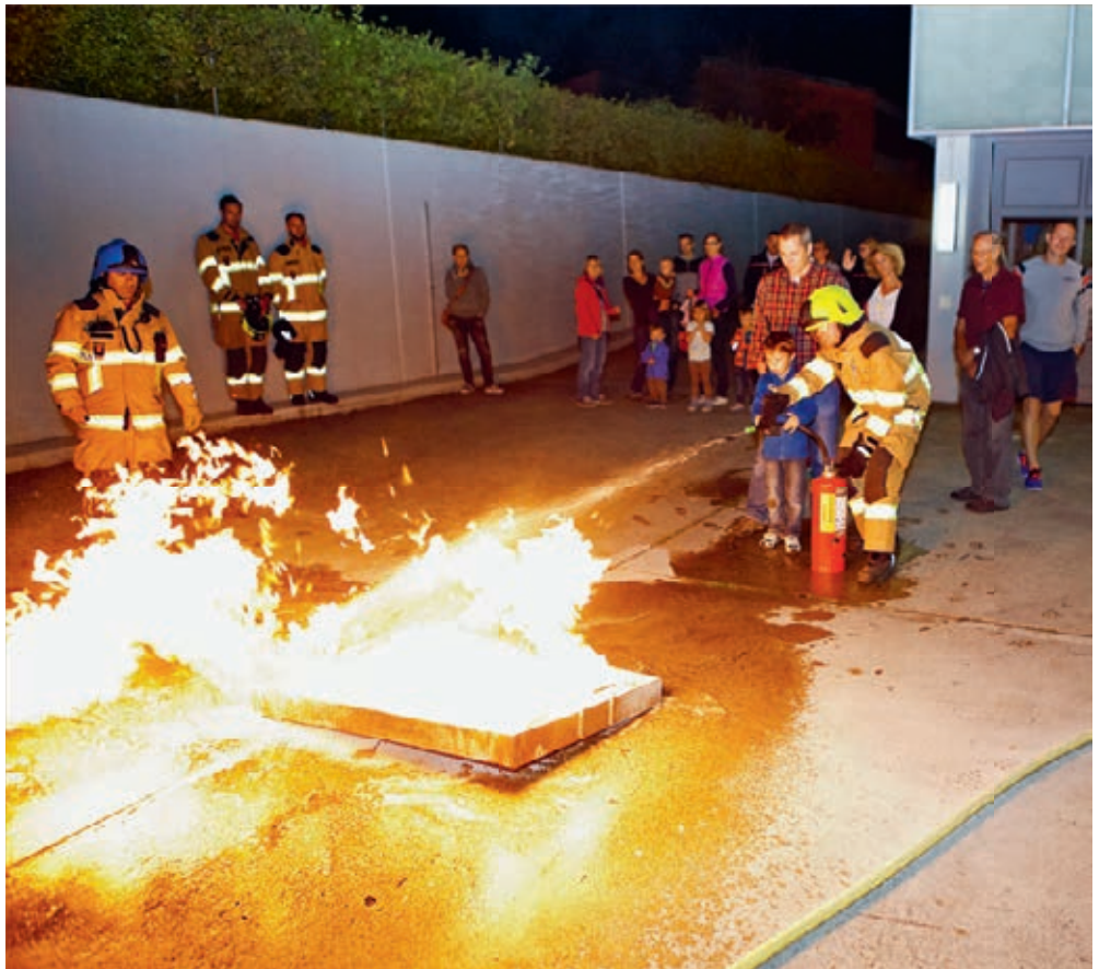
Die Feuerwehr gab praktische Tipps für kleine Brände.

Das Feuerwehrkommando bedankt sich bei allen Beteiligten für die gute Zusammenarbeit.