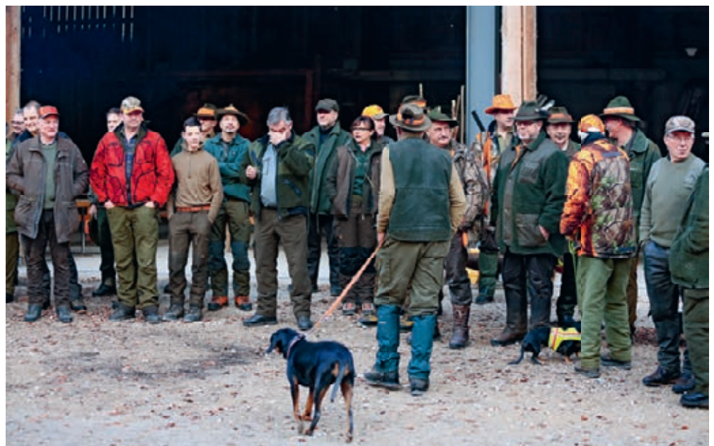
Instruktion von Jägern und Treibern vor der Jagd.

Nach bestandener Jagdprüfung wird der Jungjäger/die Jungjägerin in der Jagdgesellschaft Flue während einem Jahr Jahresgast. In dieser Zeit hat er/sie die Gelegenheit, das praktische Jagen zu erlernen und zu vertiefen.