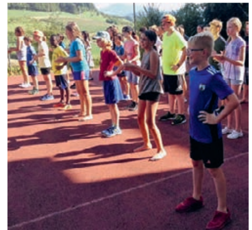
Amerika: Line Dance.