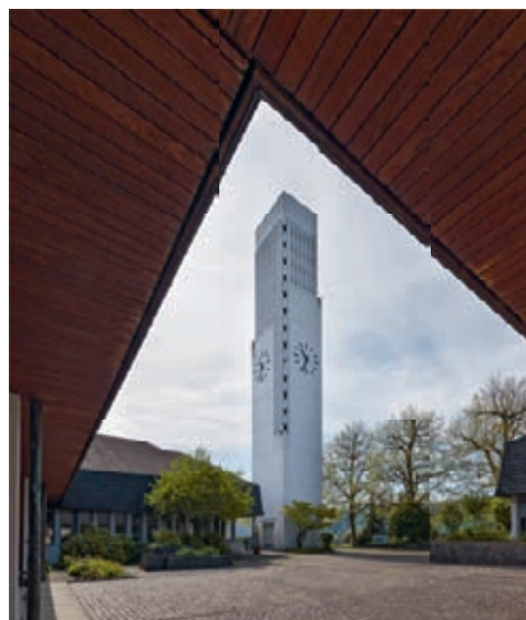
Reformierte Kirche, Breitensteinstrasse 45.