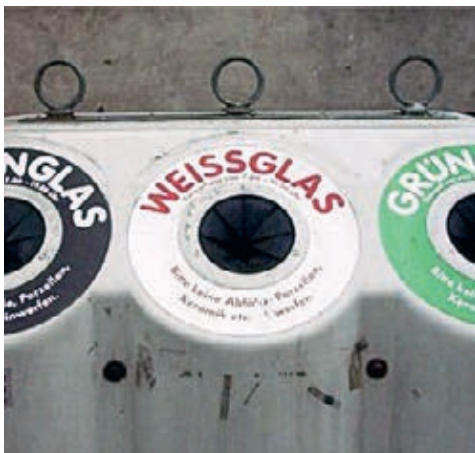
Tatsache 1: Altglas farblich getrennt sammeln!

Falsch! Technisch ist es zwar möglich, Metalle aus der Kehrichtschlacke zurückzugewinnen, weitaus sinnvoller ist es jedoch, diese über die Separatsammlung zu entsorgen. Während des Verbrennungsvorgangs in den KVAs wird die Qualität der Metalle derart vermindert, dass sich diese oft nicht mehr für eine gleichwertige Wiederverwertung eignen. Grössere Metallteile stellen zudem für den Verbrennungsprozess eine Gefahr dar, indem sie den Einfülltrichter des Verbrennungsofens verstopfen oder den