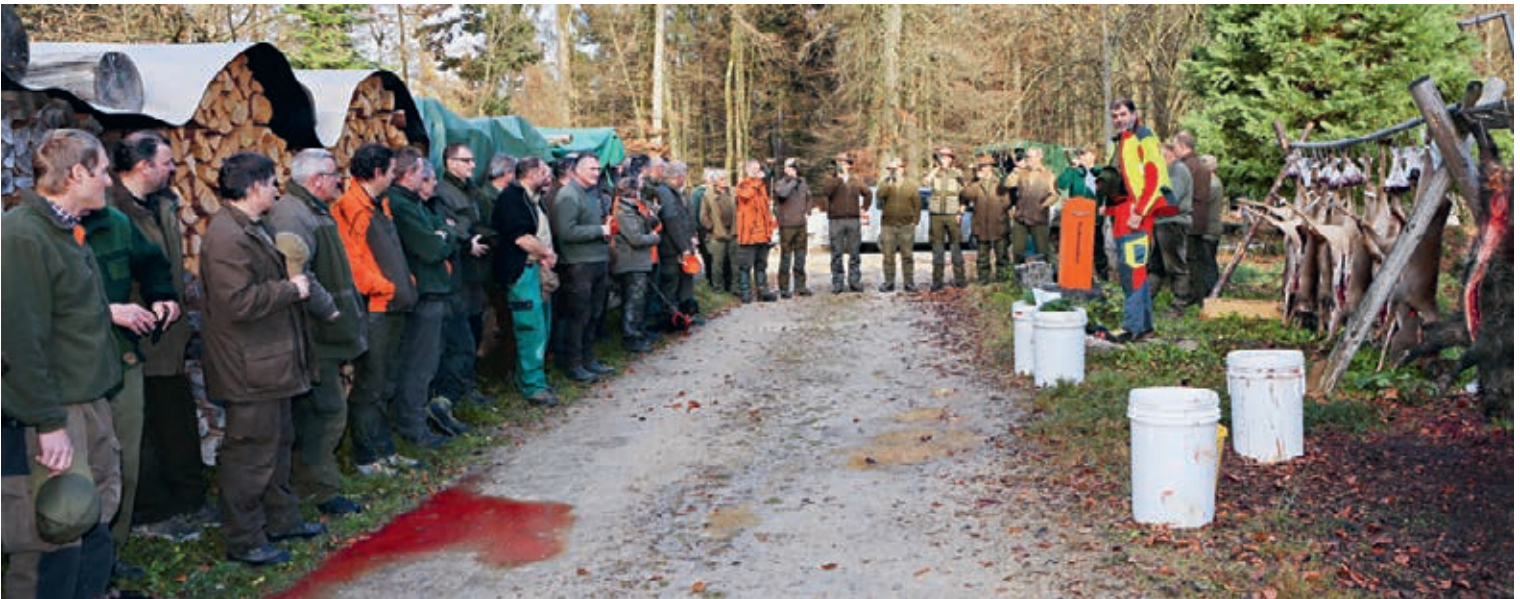
«Abblasen» einer von zwei jährlichen effizienten Bewegungsjagden.

Jäger zu sein, ist die eine Voraussetzung, doch zum Jagen braucht es noch sehr viel mehr Vorbereitungen. Bis es wirklich zu einem Abschuss kommt, lernt der Jäger sein Revier kennen. Er erkundet die Lebensräume der Tiere und die Wege (Fährten), die sie gehen. Beim sogenannten Ansitzen auf den verschiedenen Hochsitzen in seinem Revier beobachtet er die Tiere und kennt dadurch deren Bestand und welche gesund oder evtl. krank sind, welche Jungtiere sich gut und welche sich weniger gut entwickeln. Er sieht den Rehen an, wie die letztjährigen Wetterbedingungen waren. Sind sie gut genährt, gab es viel Futter (z.B. milder Winter). Sind sie weniger gut genährt, war es ein strenger Winter oder es gab zu viele Unruhen z.B. durch Freizeitsportler im Wald, sodass ihnen die wichtige Ruhe zum Wiederkäuen mehrheitlich fehlte. Gibt es überdurchschnittlich viele kranke Tiere, so sind deren Bestände evtl. zu gross oder das Wetter war längere Zeit zu nass und sehr kalt.