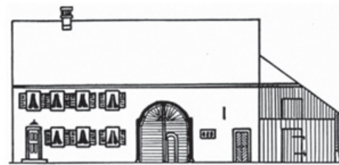
Ortsmuseum Untersiggenthal seit 1980

Nach der grossen Landwirtschaftsausstellung ist die nächste Ausstellung bereits geöffnet: 150 Jahre Schützengesellschaft