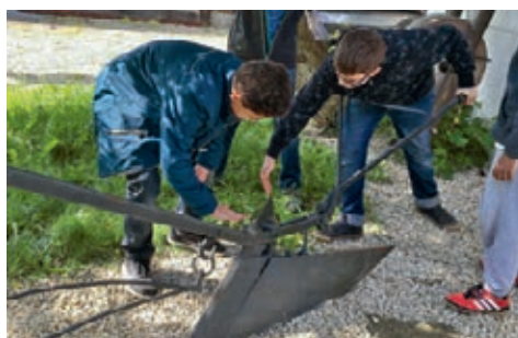
Gut, dass man nicht mehr per Hand pflügen muss.