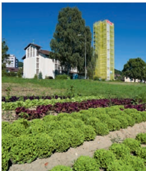
Katholische Kirche, Dorfstrasse 104.