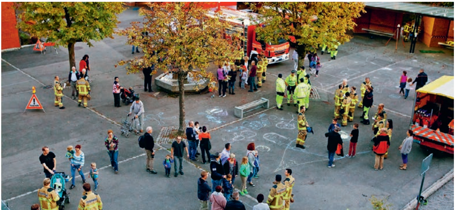
Zahlreiche Interessierte verfolgten die Feuerwehrübung.

Der Kommandant blickte auf ein vergleichsweise eher ruhiges Feuerwehrjahr zurück. Durchschnittlich waren weniger Einsätze zu bestreiten, was als durchaus erfreulich gewertet werden darf. Als eines der Highlights konnte der neue Personentransporter in Empfang genommen werden, welcher mit einer Kapazität von 17 Feuerwehrleuten rasch viele Einsatzkräfte auf den Schadensplatz bringen kann.