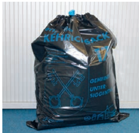
Tatsache 2: Kehrichtsäcke werden nicht sortiert!