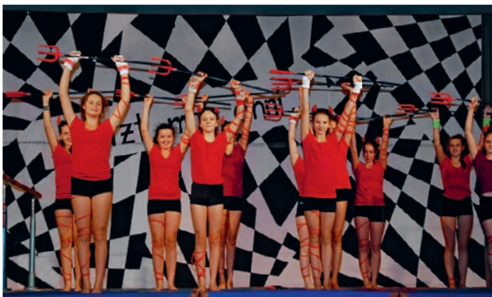
Die Proben für die Turnervorstellung laufen auf Hochtouren.

Im Januar werden die Dorfvereine für ihre Mithilfe angefragt; sie werden gemäss ihren geleisteten Stunden entschädigt und am Holzkohleverkauf beteiligt. Bau und Betrieb des Kohlenmeilers werden durch Vereinsmitglieder ausgeführt. Der Köhlerverein ist überzeugt, der Bevölkerung wieder schöne Zusammenkünfte im Rotchrüz zu bieten und das Dorfleben zu aktivieren.