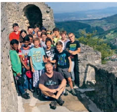
Europa: Die «alte Welt».