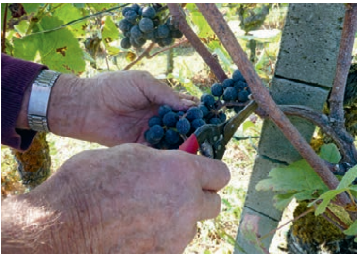
Es braucht viele Hände bei der Weinlese.