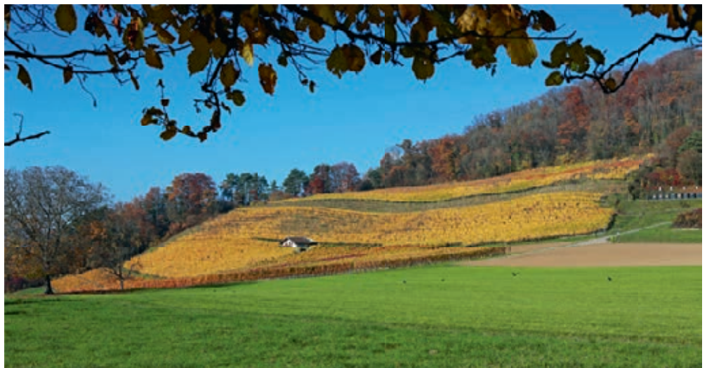
Rebberg Schlatt mit Rebhüsi.

Nach der Lese und dem Pressen der Trauben wird der Wein in Stahlbehältern gelagert. Einige der roten Sorten werden in Eichenfässer gefüllt. Die Fässer geben je nach Herkunft und Alter dem Wein seine eigene Geschmacksfärbung.