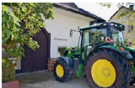
Modernes Gerät vor altem Haus.

Die Schützengesellschaft von Untersiggenthal stellt die nächste Sonderausstellung. Wir sind gespannt auf die Informationen und die Ausstellungsobjekte, die zu sehen sein werden.