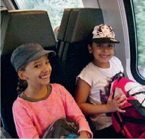
Zusammen entdecken wir die Welt. Starke Kinder sind mutig, neugierig.