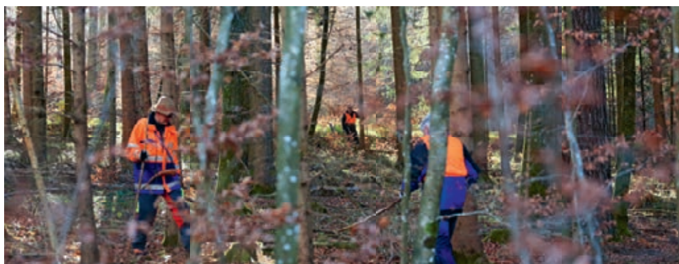
Treiber in Aktion.

Das Untersiggenthaler Jagdrevier umfasst 340 ha Wald. Dies ist gepachtet vom Jagdverein Flue mit derzeit zehn Pächtern und einem Jagdaufseher. Die Pachtverträge laufen jeweils acht Jahre. Der Pachtzins wird vom Kanton Aargau festgelegt. Die Pachtzinshöhe richtet sich hauptsächlich nach der Grösse des Reviers. Jede Jagdgesellschaft muss einen vom Kanton beglaubigten Jagdaufseher anstellen, welcher für das Bergen von Unfalltieren und alles, was mit der Jagd-