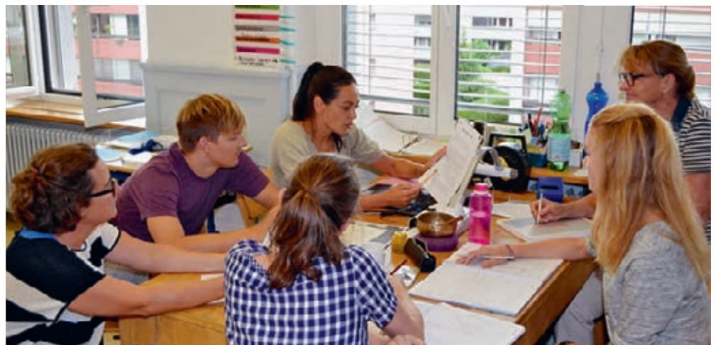
Gruppenarbeiten bieten die Möglichkeit, individuell zu fördern.