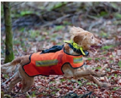
Jagdhund mit Schutzkleidung.

Die Köche des Vereins Räbechuchi zeigen im Folgenden, wie das Reh-Wildbret auf eine besonders gluschtige Art «verwertet» werden kann.