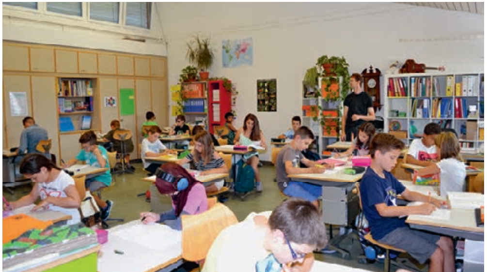
Eine Klasse bei individuellen Arbeiten.