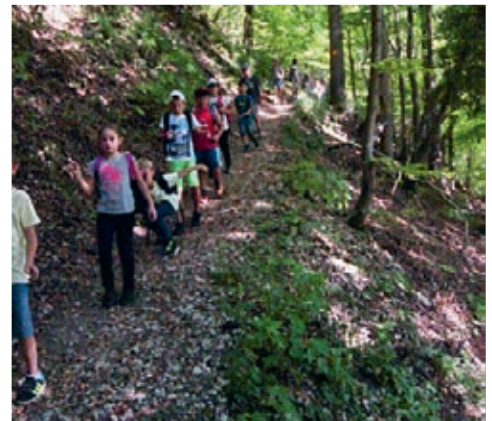
Starke Kinder nehmen aufeinander Rücksicht und gehen im richtigen Moment auf Abstand.