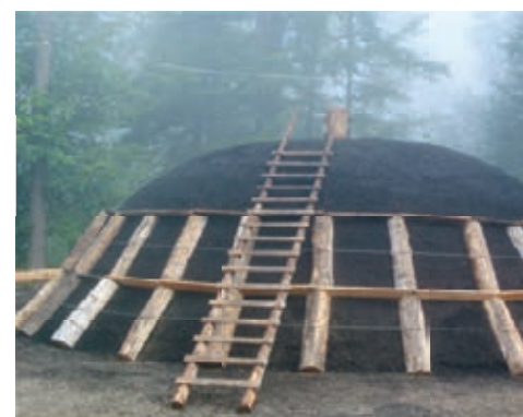
Der grosse Meiler von 2013.