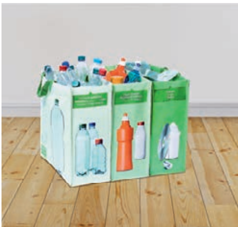
Tatsache 4: PET von anderem Kunststoff trennen!

Falsch! Batterien gehören nicht in den Haushaltsabfall. Von Gesetzes wegen bestehen in der Schweiz für Batterien sowohl eine Rückgabe- als auch eine Rücknahmepflicht.