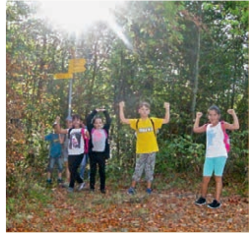
Zusammen haben wir das geschafft. Starke Kinder unterstützen einander.