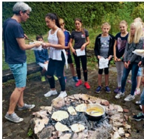
Afrika: Zubereiten von Fladenbrot.