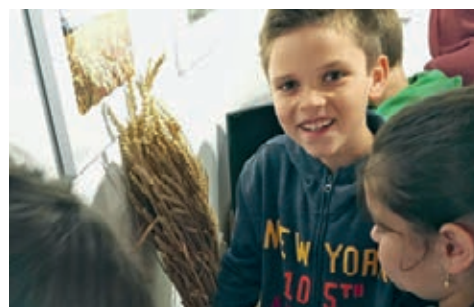
Das wird mal sein Pausenbrot.