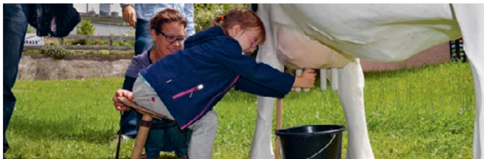
Gar nicht so leicht, eine Plastikkuh zu melken.