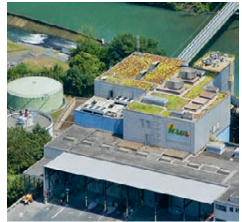
Tatsache 6: Die KVA braucht kein Papier.