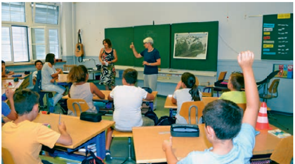
Verstärkung durch eine Sprachheiltherapeutin.