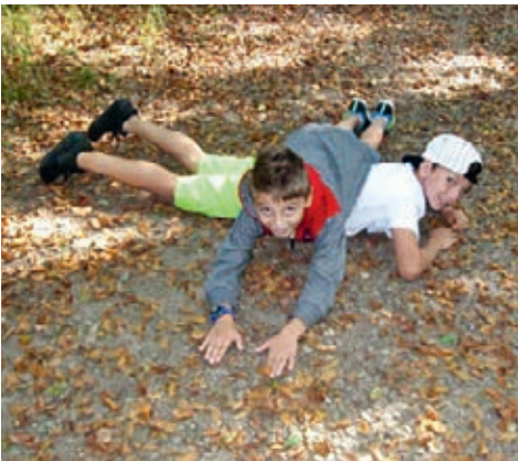
Zusammen erfinden wir lustige Sachen. Starke Kinder haben gute Ideen.