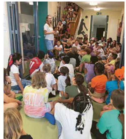
Tagesbesprechung im Lagerhaus

Ob in der Küche oder im Unterricht – Flexibilität und Führung sind entscheidend. Der Küchenchef im Lager ist im Alltag wieder als Heilpädagoge für das Lernen zuständig. Und manchmal braucht es nur wenig – eine andere Umgebung, eine weitere Person – und plötzlich «schmeckt» der Reis, oder das Lernen wird leichter.