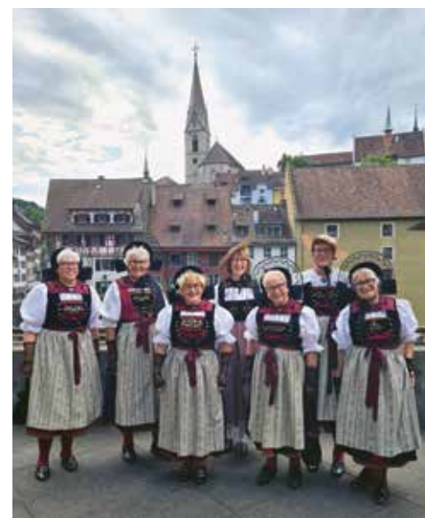
Die Trachtengruppe am Schweizerischen Tag der Tracht 2025