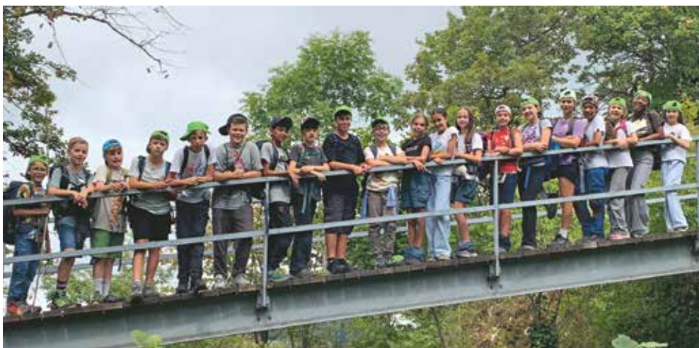
Eine Lagergruppe auf Ausflug

Das war mein Highlight aus dem mega tollen Klassenlager.