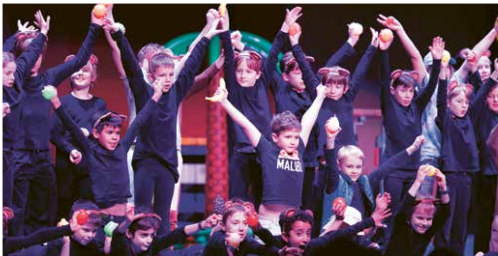
Auftritt der Jungmannschaft 2024