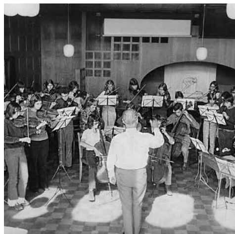
Musikschule vor 50 Jahren

Nächster Termin: Adventskonzert, Sonntag, 30. 11. 2025, 17.30 Uhr, kath. Kirche Birmenstorf.