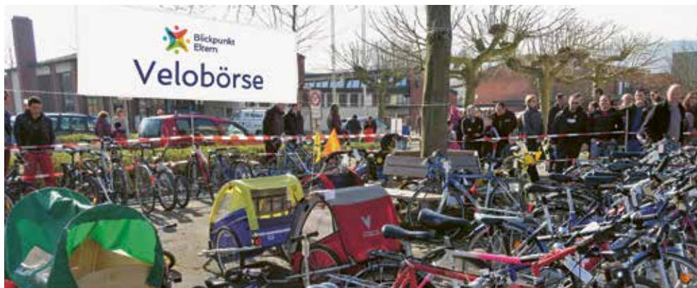
Die gut besuchte Velobörse 2024