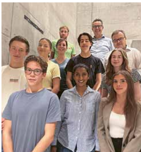
Einladene JungbürgerInnen und einladende GemeinderätInnen.

Dann wurde es gemütlich. Die Räbe-Chuchi zauberte wie immer ein feines Nachtessen, und die Teilnehmenden nutzten die Gelegenheit, miteinander ins Gespräch zu kommen. Schon der Apéro konnte sich sehen lassen: knusprige Zucchetti-Pfannkuchen, dazu ein frischer Salat.