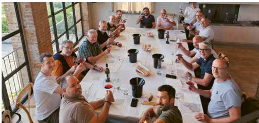
Vorfrende auf ein feines Znacht nach getaner Arbeit