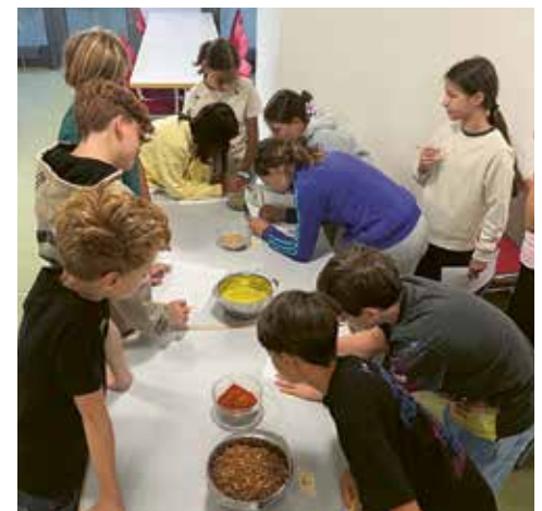
Wer erkennt die meisten Gewürze?