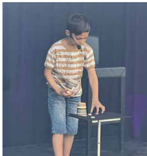
Volle Konzentration auf der Zauberbühne

Sonntag, 7. Dez. 2025, 10 bis 12 Uhr: Museum geöffnet mit Sonderausstellung «Zauberei»