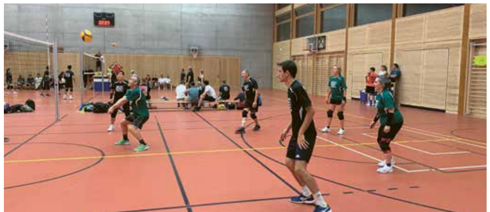
Volley Siggimix spielt an der Volleynight 2025.