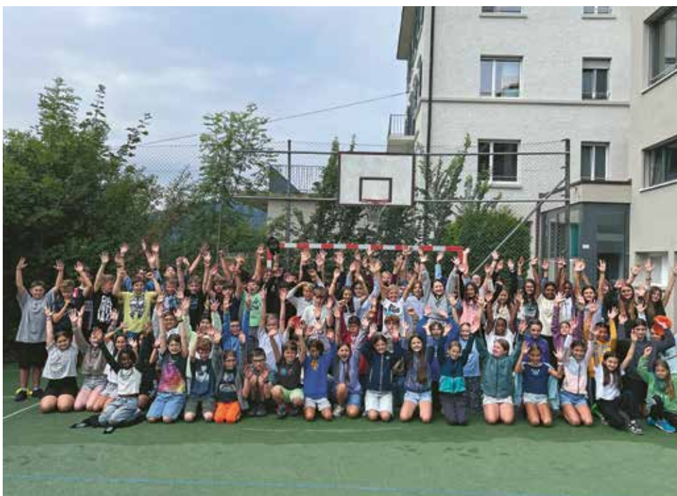
Gruppenbild vor dem Lagerhaus