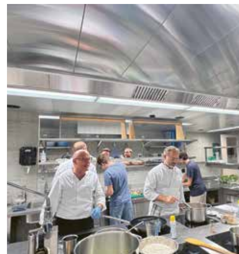
Die Räbe-Chuchi-Köche in der SICKINGA-Küche im Einsatz für die JungbürgerInnen.

Der Gemeinderat dankt allen Jungbürgerinnen und Jungbürgern für ihre Teilnahme und der Räbe-Chuchi für das köstliche Essen, das wieder einmal alle begeisterte.