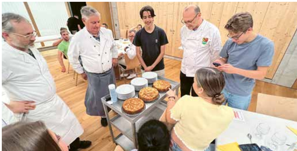
Das Dessert wurde vor dem Kosten erst einmal bestaunt.