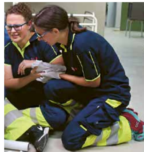
Üben macht auch bei Samariterinnen den Meister.