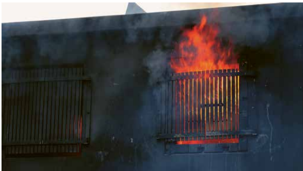
Geübt wird ein Zimmerbrand. Es lodert bereits.

Beratung, Schulung und Unterstützung erhalten Feuerwehren im Aargau von der Aargauischen Gebäudeversicherung (AGV). Deren Fachkräfte erarbeiten Standards für Material, Fahrzeuge usw. Den Entscheid, welche Ausrüstung gekauft wird, trifft