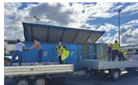
Die Siggebergstürchler bei der Arbeit

Am 14. Februar 2026 beginnt um 13.15 Uhr der Fasnachtsumzug mit anschliessenden Guggenauftritten auf dem Dorfplatz. HelferInnen sind willkommen. Melde dich doch per E-Mail bei uns: info@siggebergstuerchler.ch