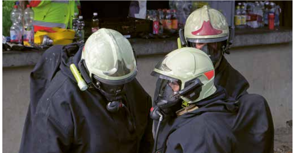
Einsatzbesprechung während der Brandbekämpfung

Einig sind sich neue und erfahrene Feuerwehrkräfte darin, dass es ein gutes und erfüllendes Gefühl ist, helfen zu können. Das Gefühl nach einem Einsatz, wenn der Stress beendet ist, das Adrenalin langsam sinkt und man zusammensteht, um den Fall zu besprechen, ist einfach «mega». Die Kameradschaft und das Zugehörigkeitsgefühl sind unbeschreiblich.