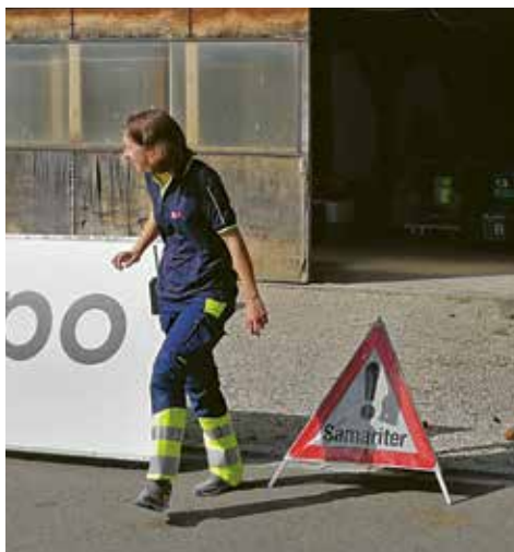
Im Einsatz bei einem Notfall

Nächste Monatsübung: 14.01.2026 / 19.30 bis 21.30Uhr