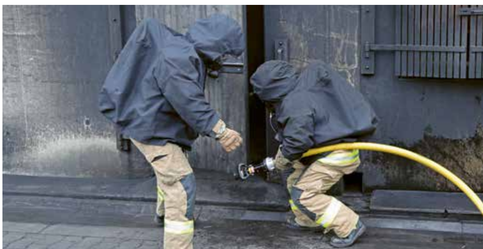
In voller Montur verschaffen sich Atemschutzspezialisten Zugang zum Gebäude ...