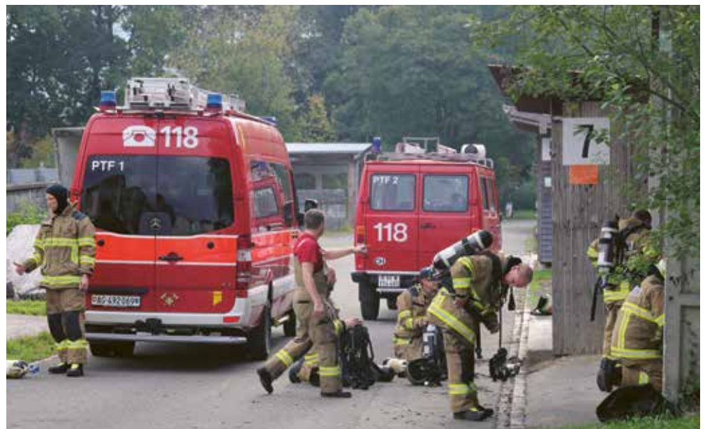
Ankunft der Atemschutztruppe am Übungsort in Eiken am 4. Oktober 2025

Damit Neurekrutierte einen schnellen Einstieg erhalten, besuchen sie im ersten Jahr eine zusätzliche Übung wie auch einen zweitägigen Einführungskurs.