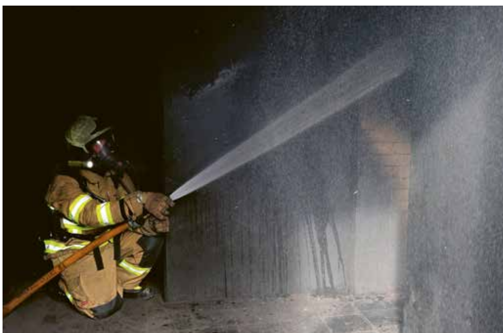
... und beginnen mit dem Löschen des Brandes.