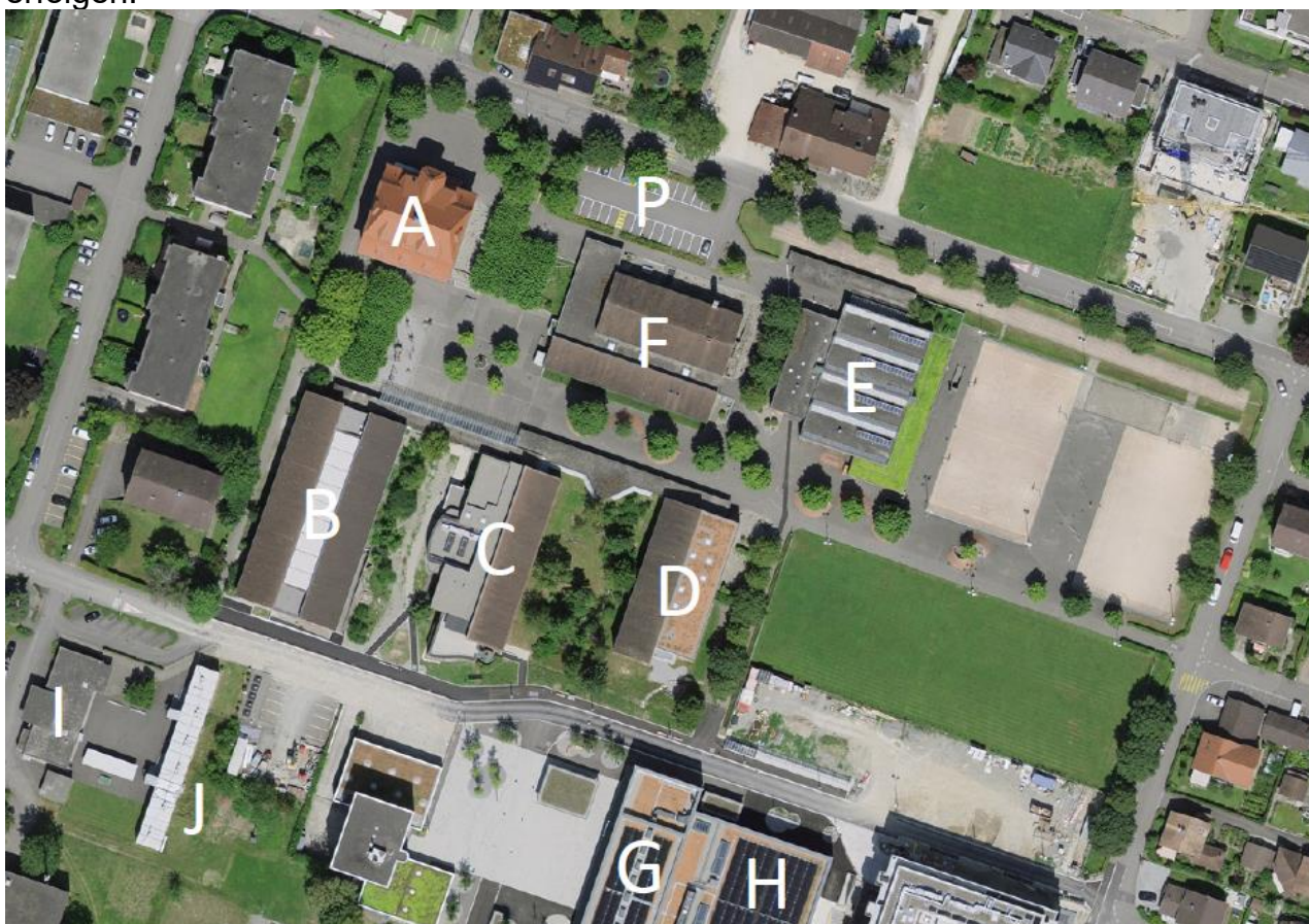
Abbildung: Luftbild mit heutiger Schulanlage (Schulhäuser A, B, C und D, Doppelturnhalle E) und Baubereich (F)

Die Gemeinde verzeichnet seit mehreren Jahren ein überdurchschnittliches Bevölkerungswachstum. Diese Entwicklung führt zu einem steigenden Bedarf an öffentlicher Infrastruktur, insbesondere im Bildungsbereich. Die bestehenden Schulbauten haben ihre Kapazitätsgrenzen erreicht. In der Oberstufe wird bereits heute ein Jahrgangszug in den Provisorien unterrichtet. Auch im Kindergarten besteht zusätzlicher Raumbedarf. Derzeit ist eine Abteilung im Untergeschoss des Schulhauses B (Kindergarten Dorf) untergebracht. Basierend auf der prognostizierten Entwicklung der Schülerzahlen ist im Kindergarten auf das Schuljahr 2030/31 die Eröffnung einer weiteren Abteilung vorgesehen. Um dem wachsenden Bedarf gerecht zu werden, soll die Planung eines zusätzlichen Schulgebäudes im Rahmen eines einstufigen Projektwettbewerbs im offenen Verfahren erfolgen.