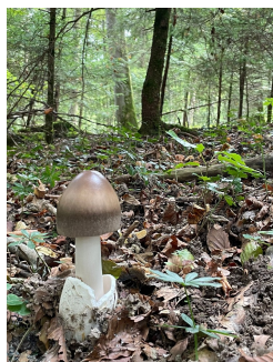
Zweifarbiger Egerlingschirmpilz ( Leucoagaricus ionidicolor )

(89 kg) zum Verzehr freigegeben werden. 5.2 kg (3.5 kg) mussten als "kein Speisepilz" (ungeniessbar, verdorben) und 0.8 kg (0.3 kg) als giftig beschlagnahmt werden. Eingeklammert die Zahlen aus dem letzten Jahr.